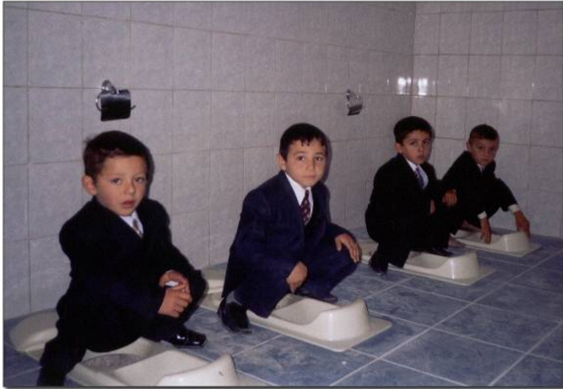
Training Course on Ecosan in pilot village Hayanist, Armenia